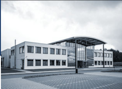
ADAC Fahrsicherheitszentrum Berlin-Brandenburg GmbH

Die Gründe, warum wir in diesem Jahr das ADAC-Fahrsicherheitszentrum Berlin-Brandenburg für Sie gewählt haben, liegen auf der Hand: Dank der dort vorhandenen vielseitigen und modernen Räumlichkeiten und Vorführhallen, können viele der Vorträge und Workshops live am Fahrzeug stattfinden! Ein weiterer Pluspunkt ist natürlich das imposante Außengelände, das sich hervorragend für unser aktionsgeladenes Outdoor-Programm eignet.